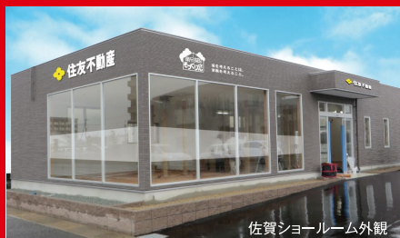
佐賀ショールーム外観