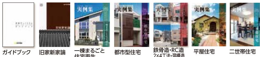
ガイドブック 旧家新家論 一棟まるごと住宅再生 都市型住宅 鉄骨造・RC造2x4工法・混構造 平屋住宅 二世帯住宅