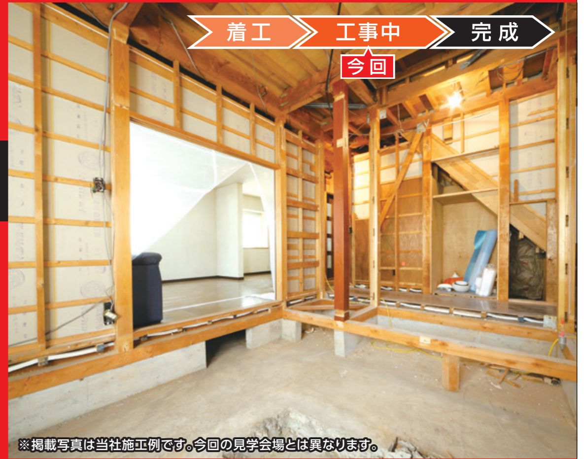
※掲載写真は当社施工例です。今回の見学会場とは異なります。