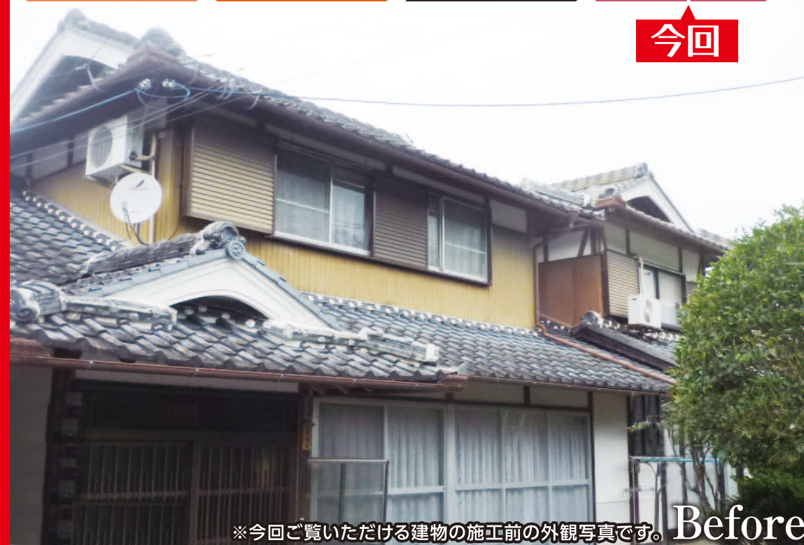
※今回ご覧いただける建物の施工前の外観写真です。Before