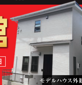
モデルハウス外観