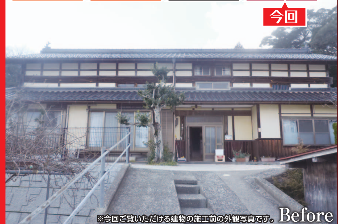
※今回ご覧いただける建物の施工前の外観写真です。Before