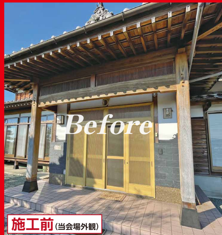
施工前 (当会場外観)