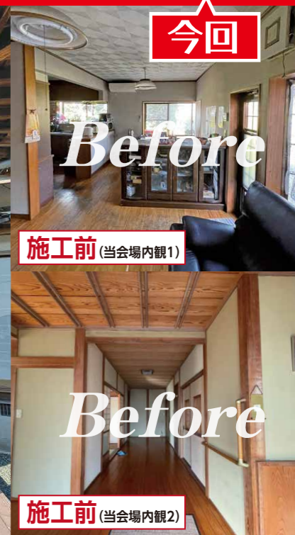
施工前 (当会場内観1)