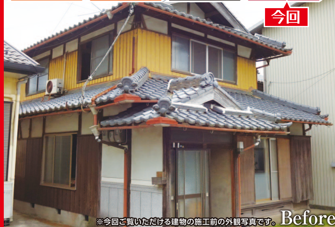
※今回ご覧いただける建物の施工前の外観写真です。Before