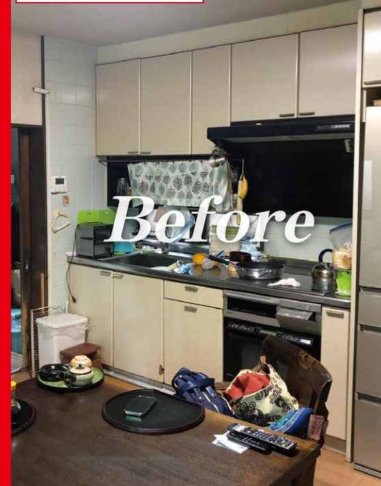
施工前 (当会場キッチン)