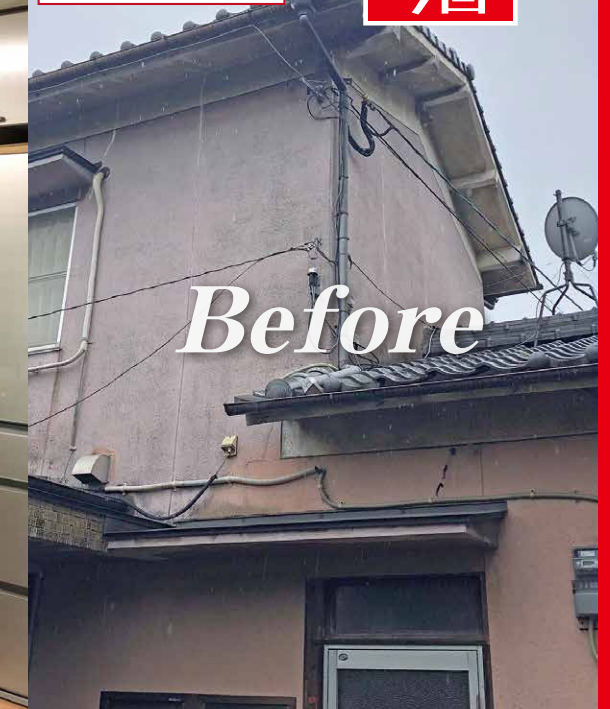
施工前 (当会場外観)