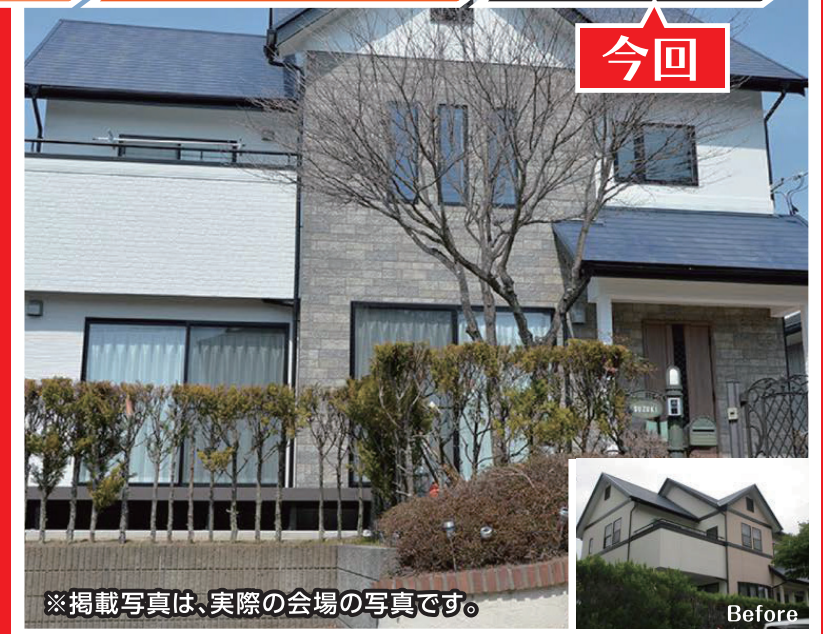
※掲載写真は、実際の会場の写真です。