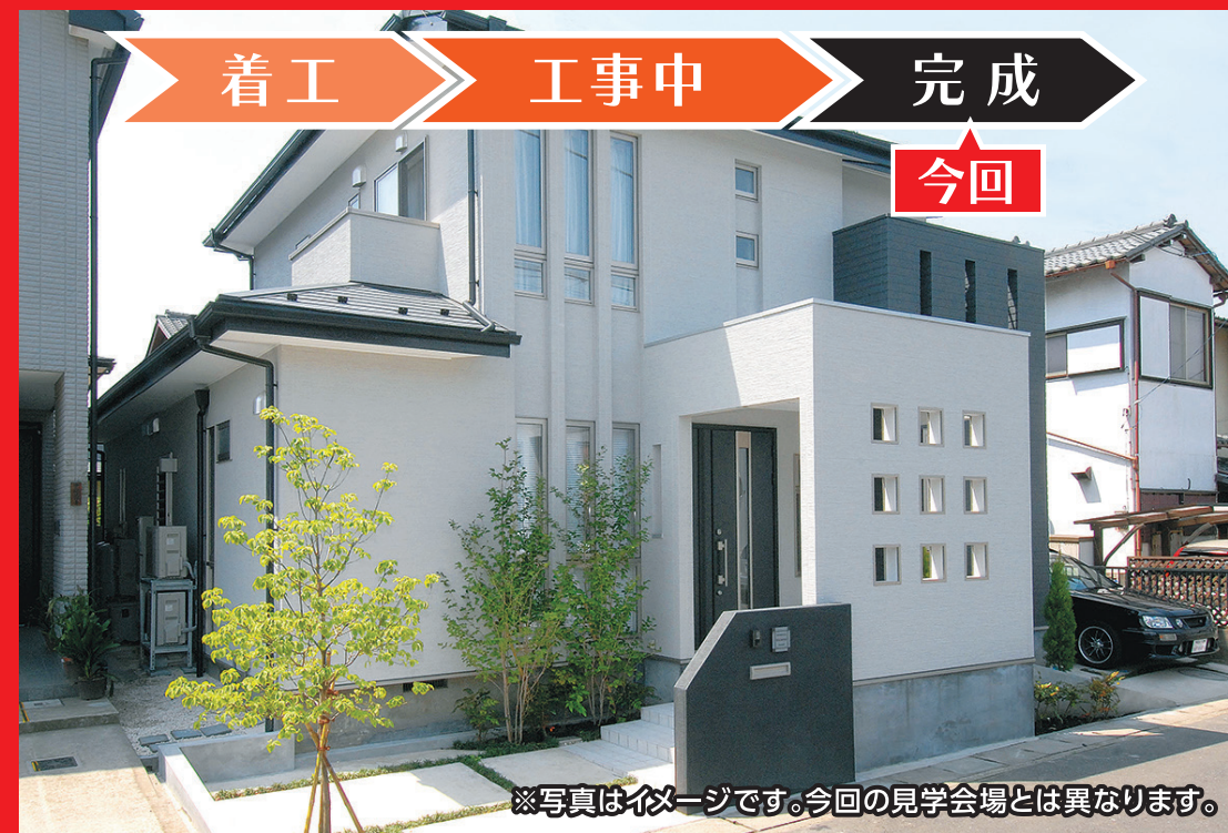
※写真はイメージです。今回の見学会場とは異なります。