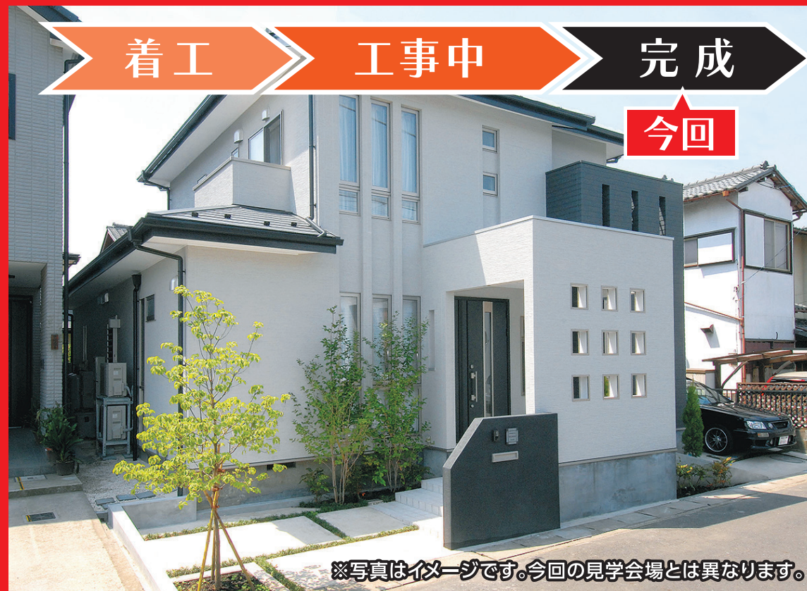
※写真はイメージです。今回の見学会場とは異なります。