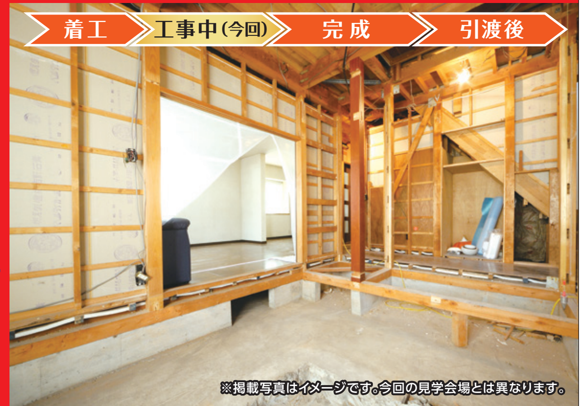
※掲載写真はイメージです。今回の見学会場とは異なります。