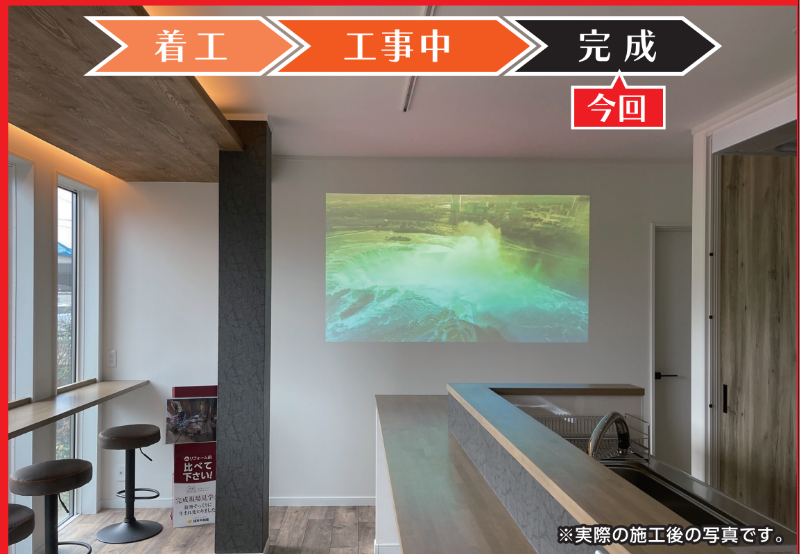
※実際の施工後の写真です。