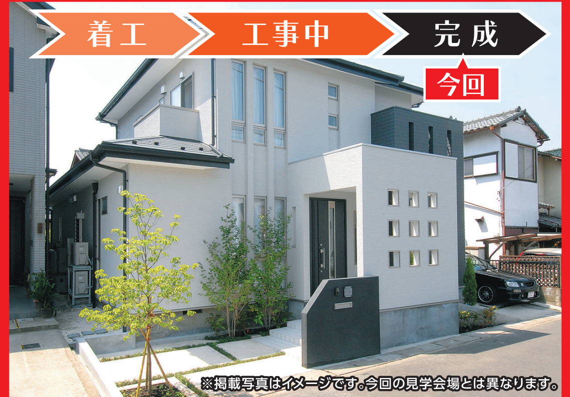
※掲載写真はイメージです。今回の見学会会場とは異なります。