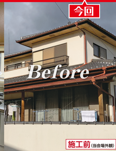
施工前(当会場外観)