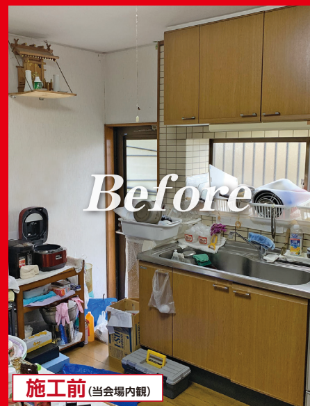
施工前(当会場内観)