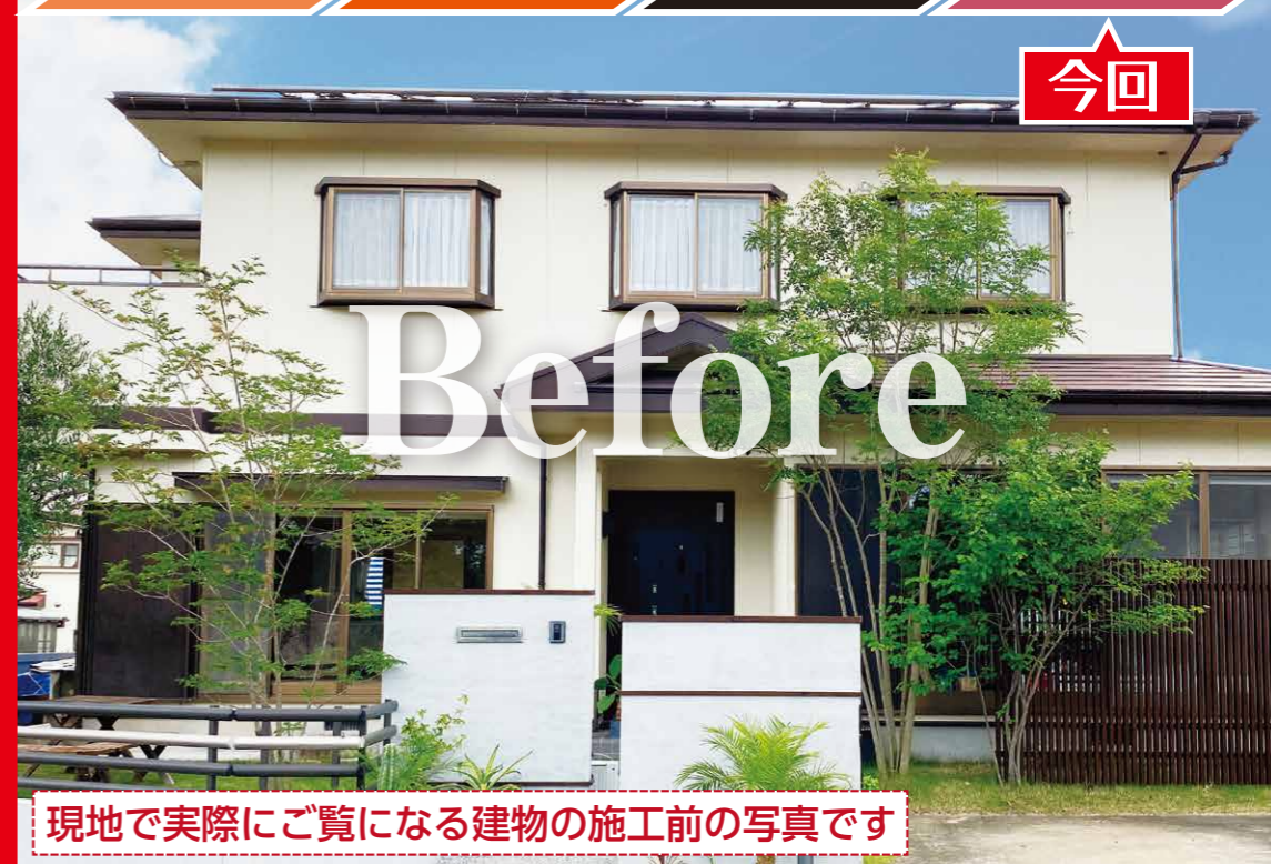
現地で実際にご覧になる建物の施工前の写真です