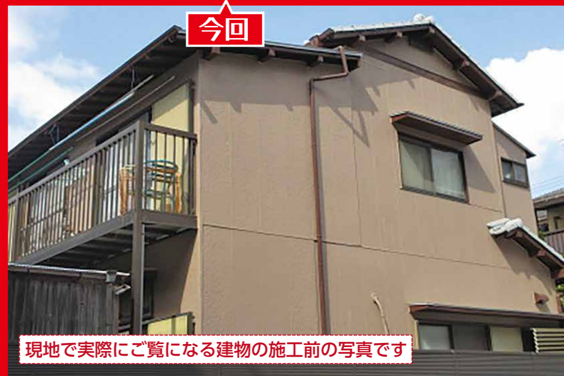
現地で実際にご覧になる建物の施工前の写真です