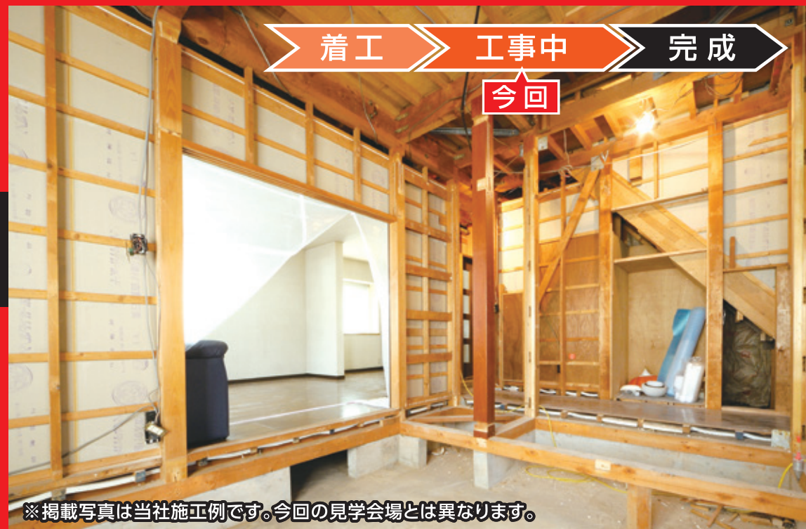
※掲載写真は当社施工例です。今回の見学会場とは異なります。