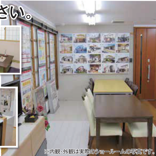
※内観・外観は実際のショールームの写真です。