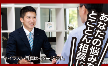
※イラスト・写真はイメージです。