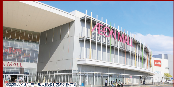
※写真はイオンモール大和郡山店の外観です