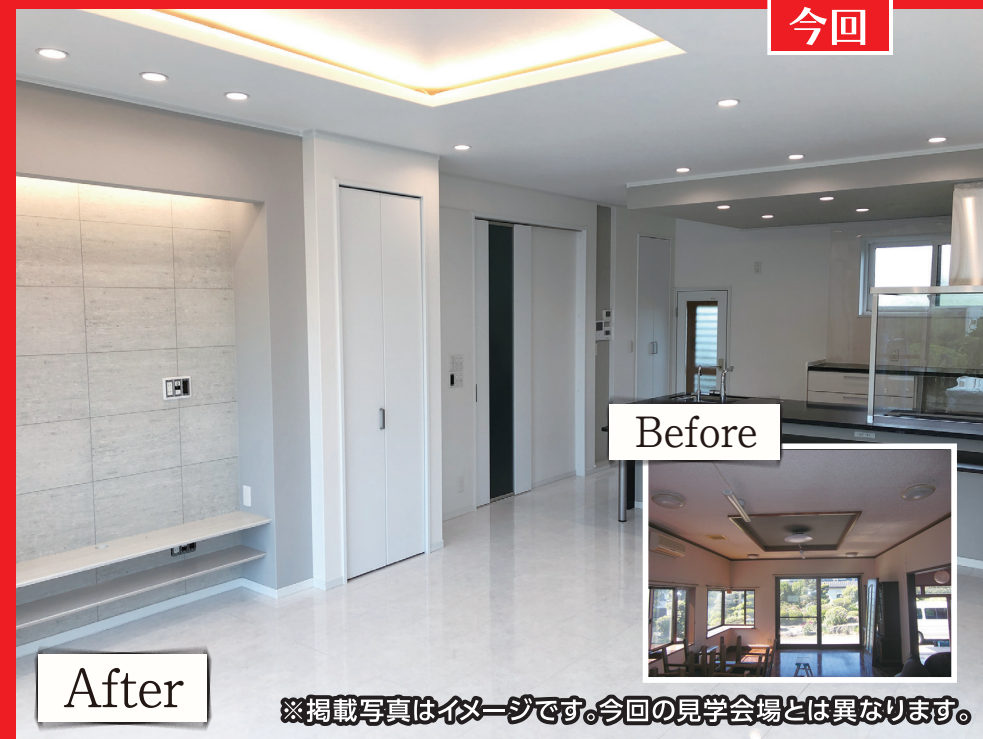
※掲載写真はイメージです。今回の見学会場とは異なります。