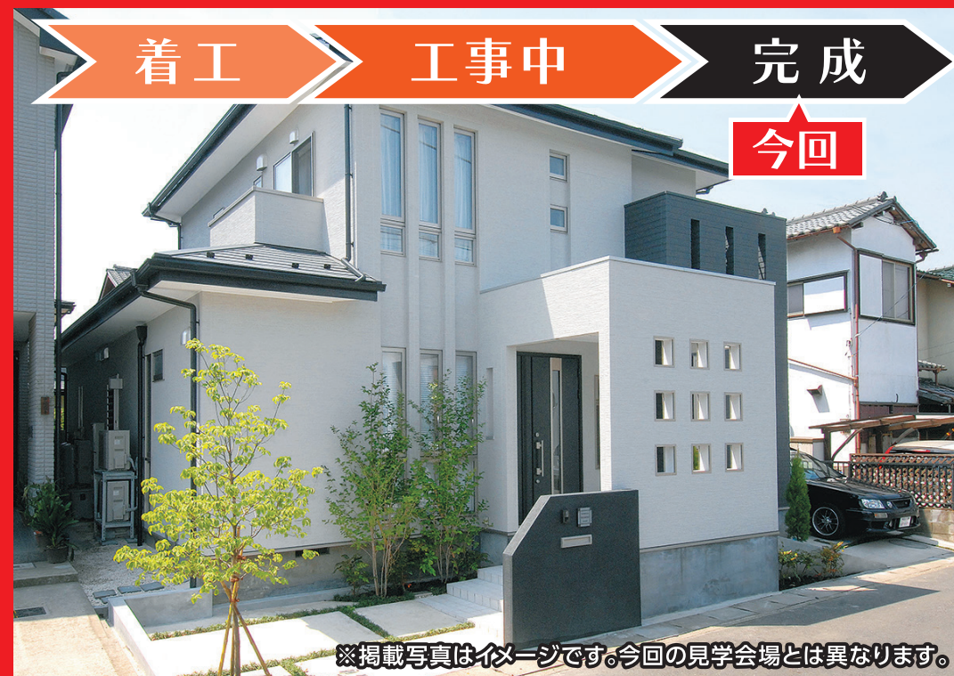
※掲載写真はイメージです。今回の見学会場とは異なります。