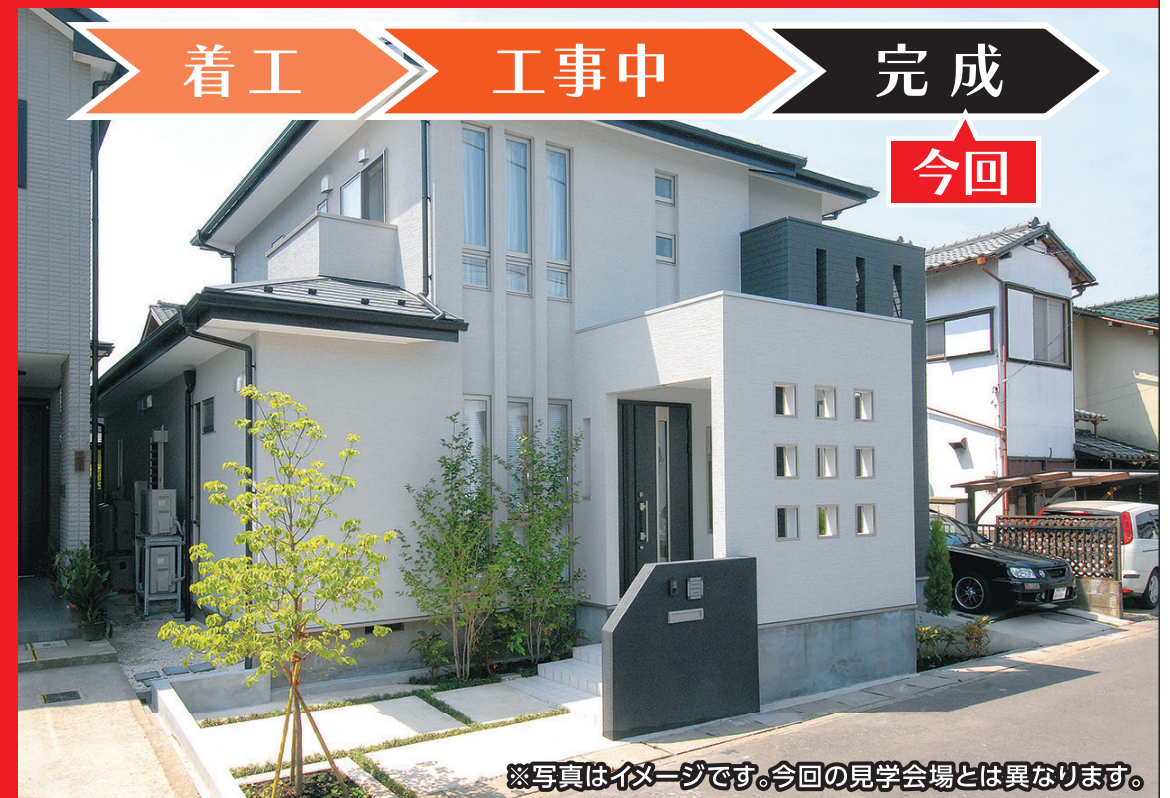
※写真はイメージです。今回の見学会場とは異なります。