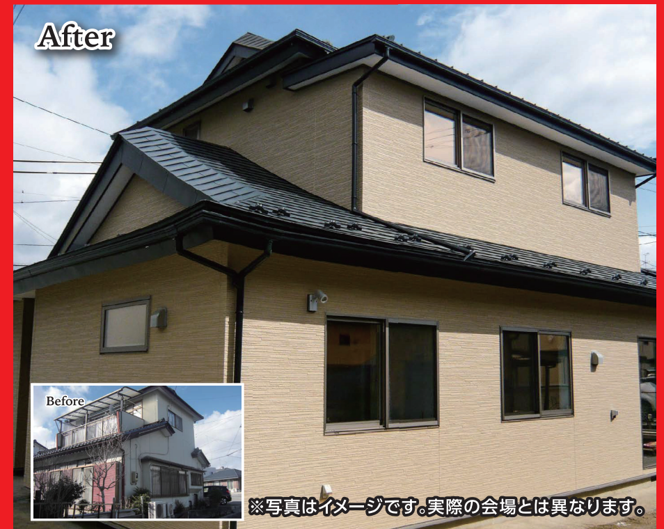
※写真はイメージです。実際の会場とは異なります。