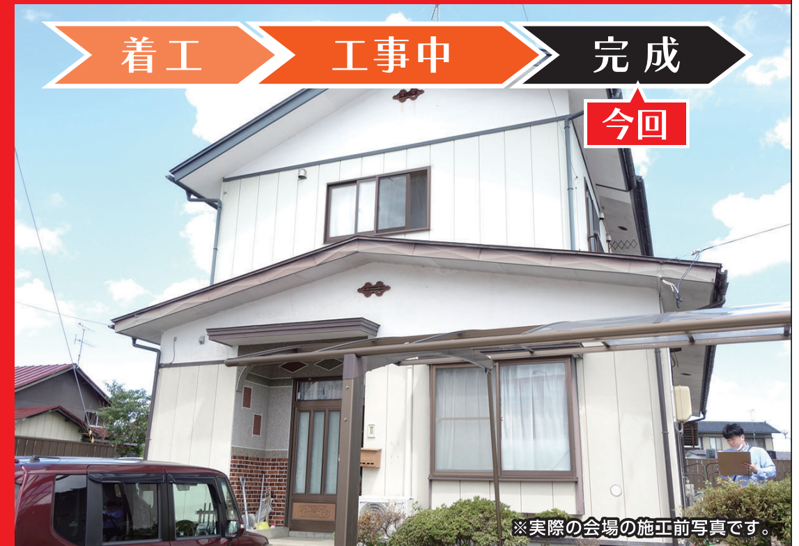
※実際の会場の施工前写真です。