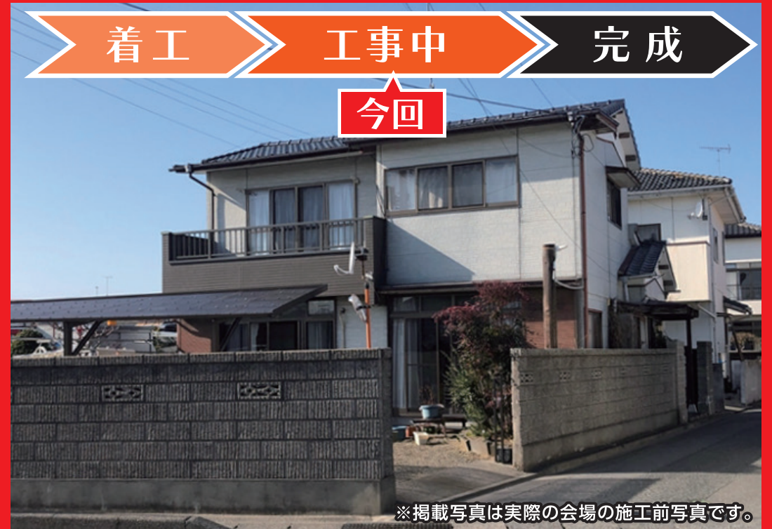
※掲載写真は実際の会場の施工前写真です。