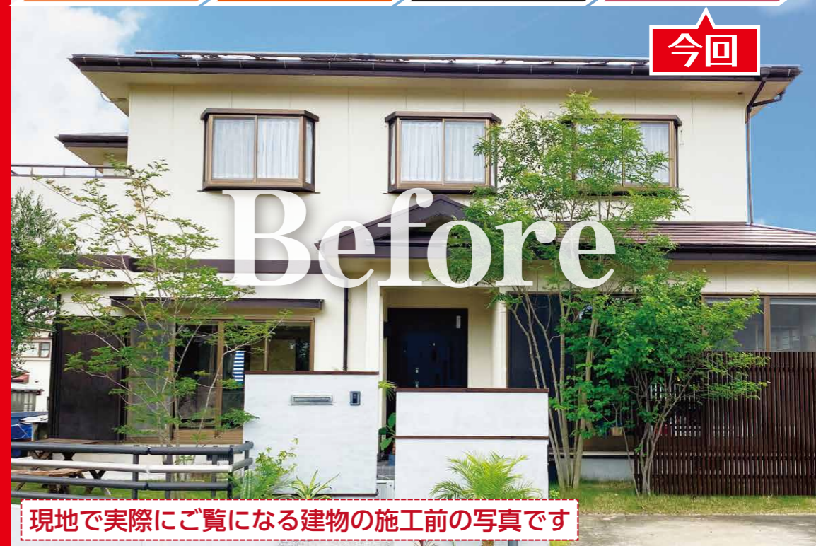
現地で実際にご覧になる建物の施工前の写真です