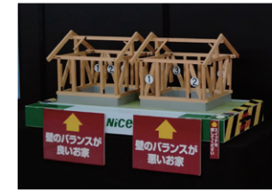
■実物大耐震補強模型

新築そっくりさんが誕生して四半世紀以上。 震度6以上の大地震を幾度も経験しましたが、 全壊・半壊した建物はなんと0件! (※)