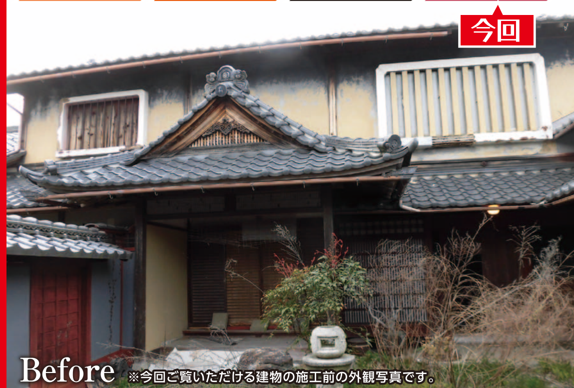
Before ※今回ご覧いただける建物の施工前の外観写真です。