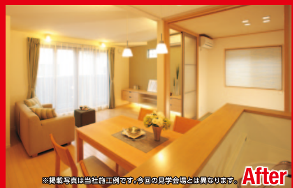
※掲載写真は当社施工例です。今回の見学会場とは異なります。After