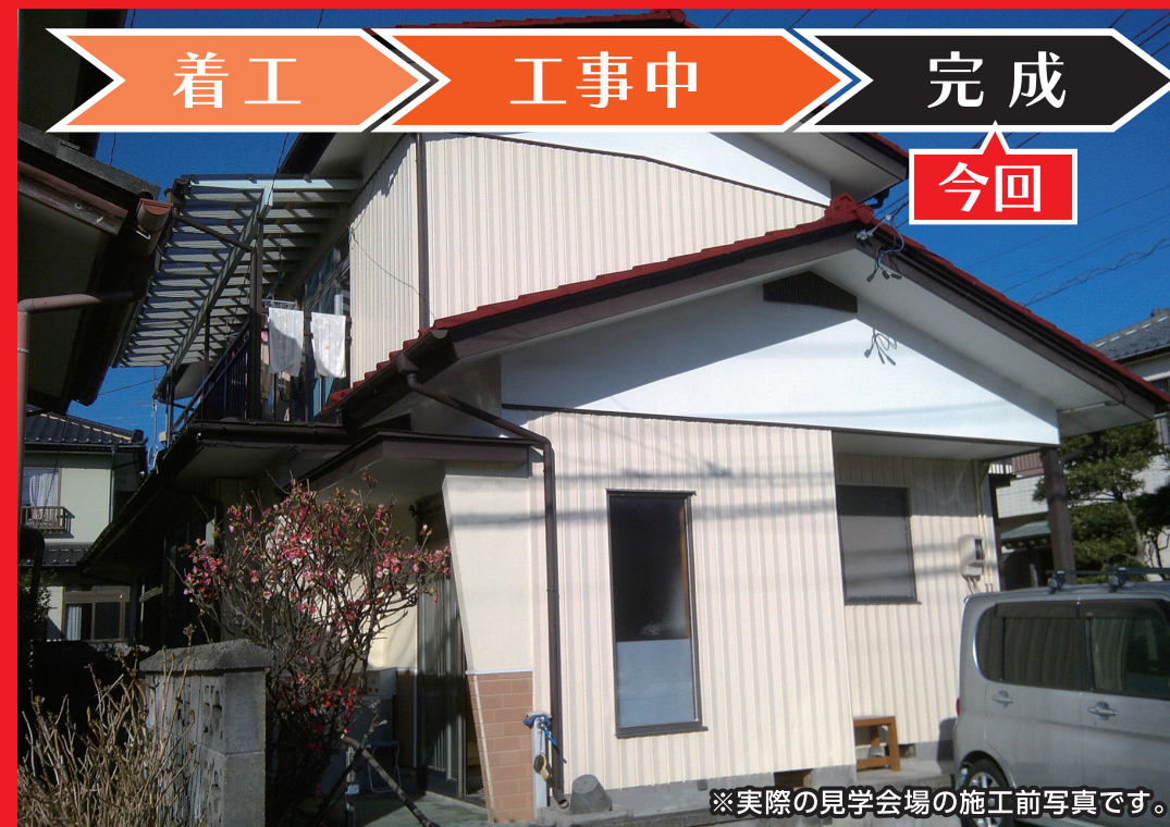
※実際の見学会場の施工前写真です。