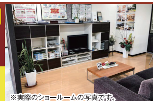
※実際のショールームの写真です。