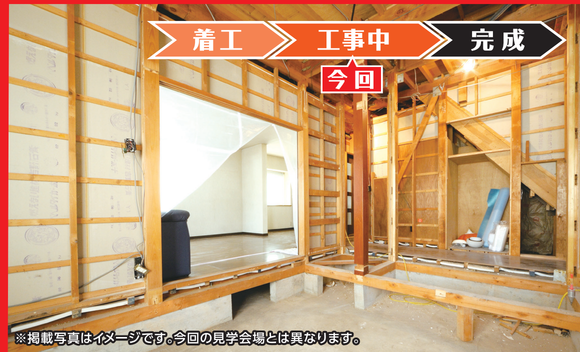
※掲載写真はイメージです。今回の見学会場とは異なります。