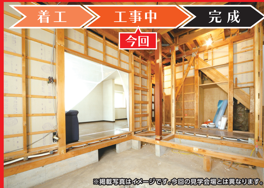
※掲載写真はイメージです。今回の見学会場とは異なります。