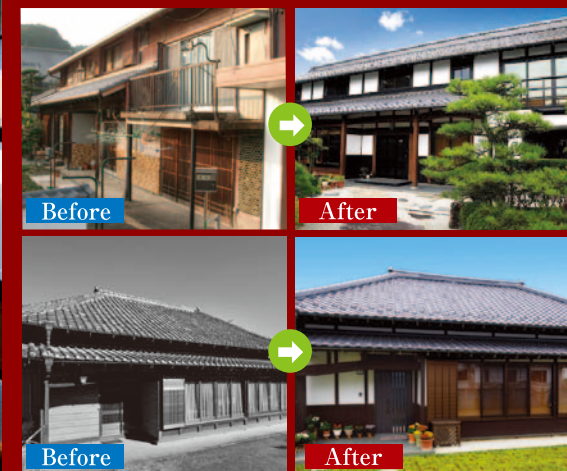
写真は全て弊社施工事例です。

住まいが古くなったからといって、すぐに建て替える必要はありません。基礎や柱など、建物を支える構造体はまだ十分に現役なのです。住友不動産の「新築そっくりさん」は基礎や柱をそのまま活かした「建て替えに代わる新システム」です。「新築そっくりさん」が現在のお住まいを美しく強い家に甦らせます。