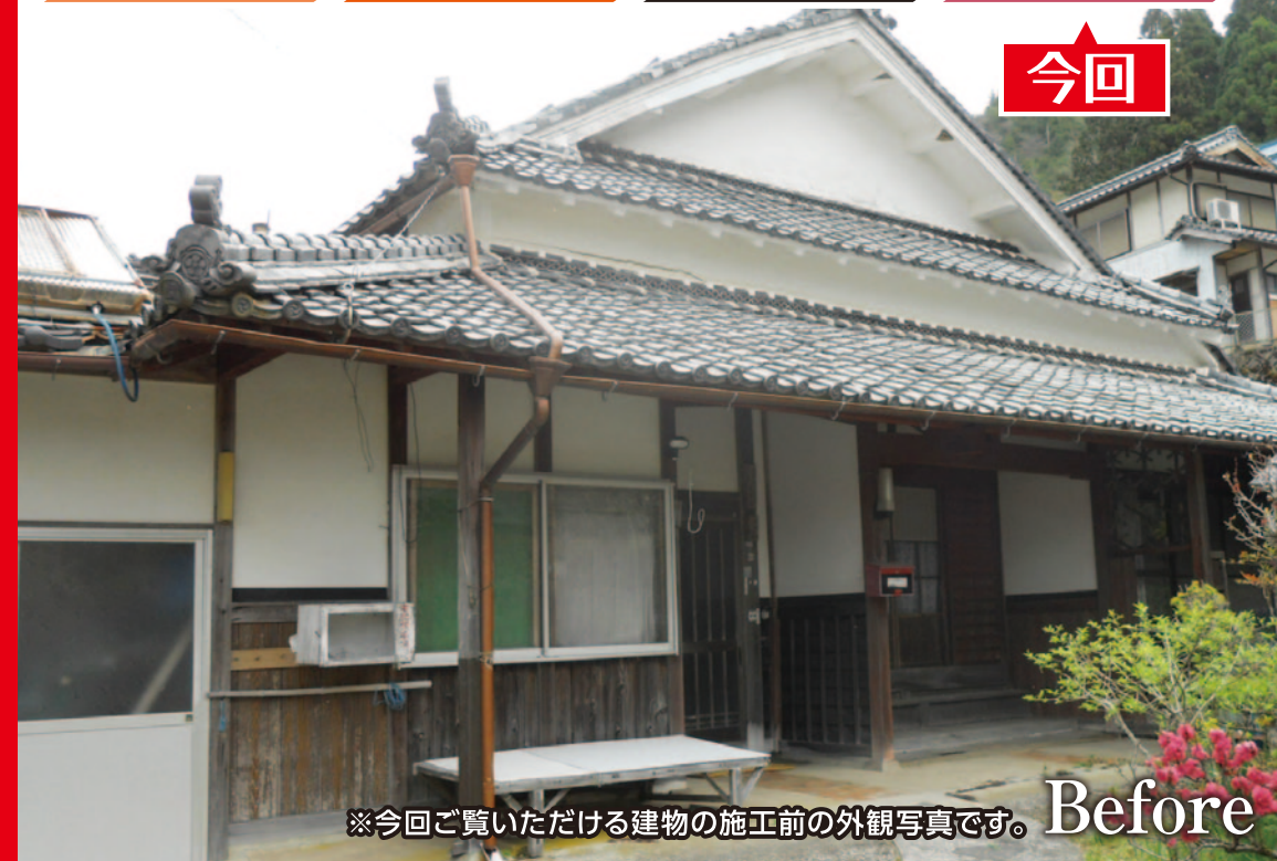
※今回ご覧いただける建物の施工前の外観写真です。Before