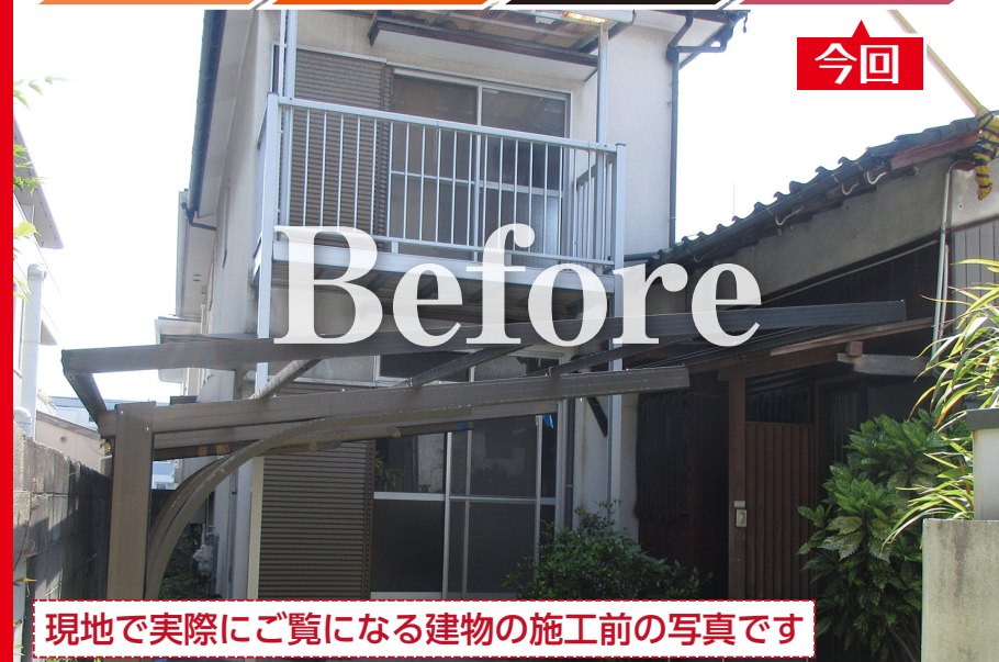
現地で実際にご覧になる建物の施工前の写真です