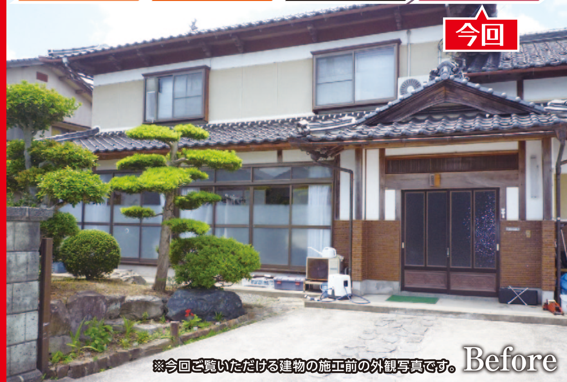
※今回ご覧いただける建物の施工前の外観写真です。 Before