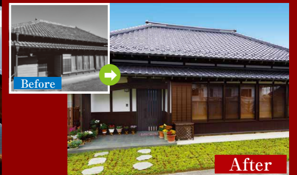
写真は全て当社施工事例です。