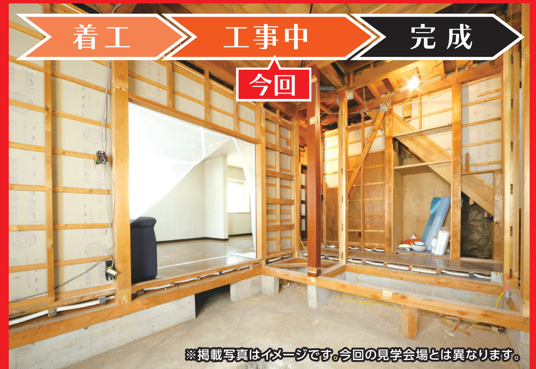
※掲載写真はイメージです。今回の見学会場とは異なります。