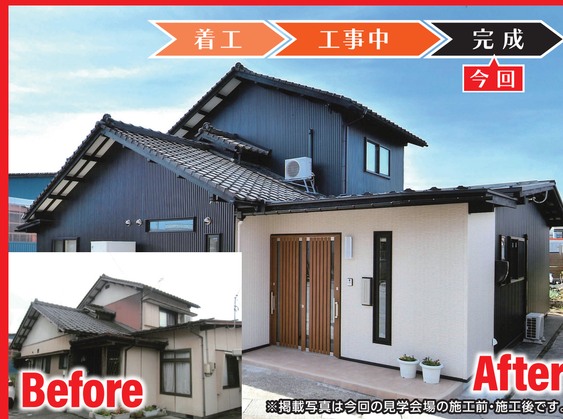
※掲載写真は今回の見学会場の施工前・施工後です。