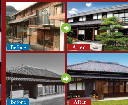
写真は全て弊社施工事例です。

住まいが古くなったからといって、すぐに建て替える必要はありません。基礎や柱など、建物を支える構造体はまだ十分に現役なのです。住友不動産の「新築そっくりさん」は基礎や柱をそのまま活かした「建て替えに代わる新システム」です。「新築そっくりさん」が現在のお住まいを美しく強い家に甦らせます。