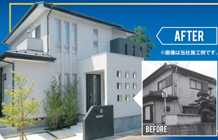
AFTER ※画像は当社施工例です。