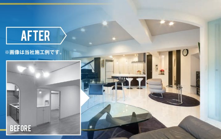
AFTER ※画像は当社施工例です。