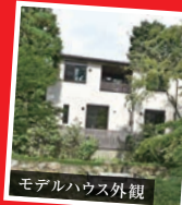
モデルハウス外観