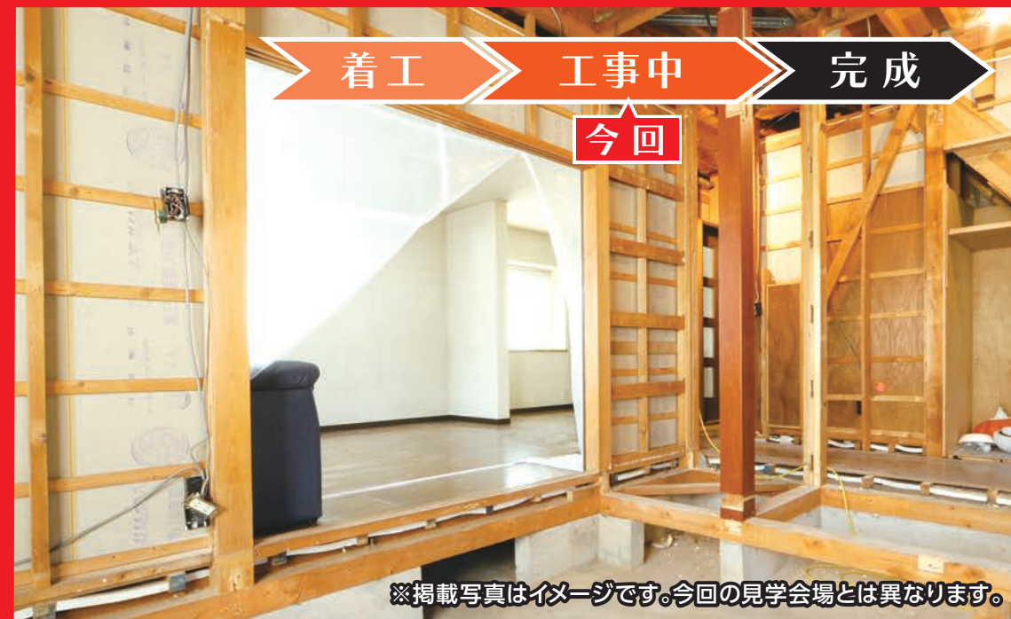
※掲載写真はイメージです。今回の見学会場とは異なります。