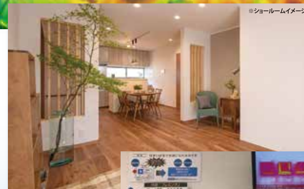
※ショールームイメージ