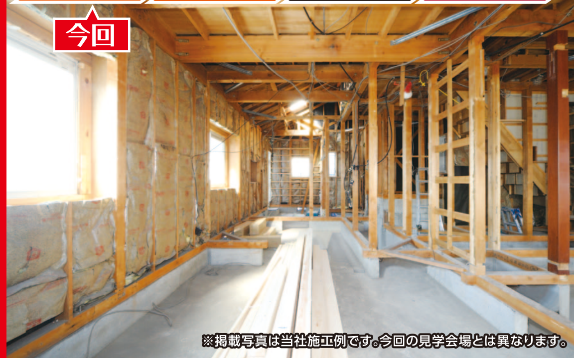
※掲載写真は当社施工例です。今回の見学会場とは異なります。