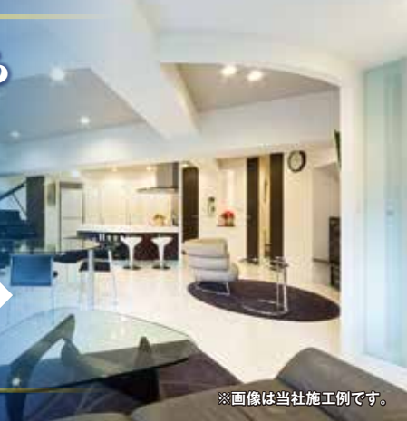
※画像は当社施工例です。