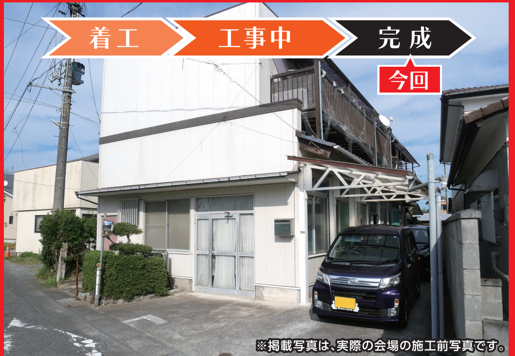
※掲載写真は、実際の会場の施工前写真です。